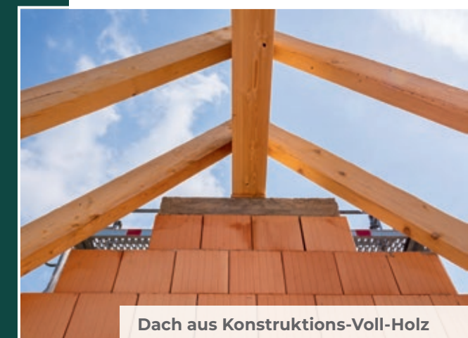
Dach aus Konstruktions-Voll-Holz