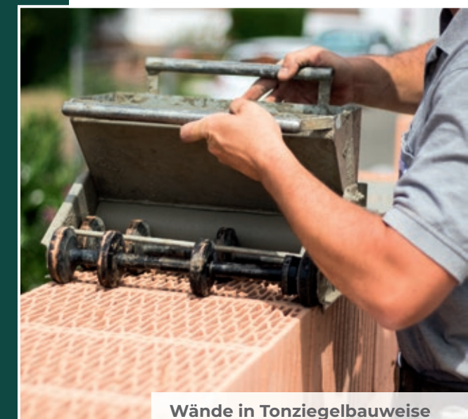
Wände in Tonziegelbauweise