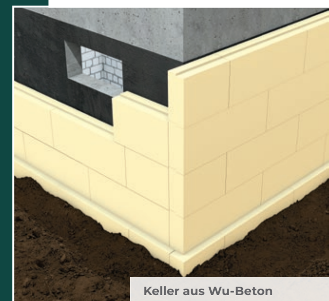
Keller aus WU-Beton